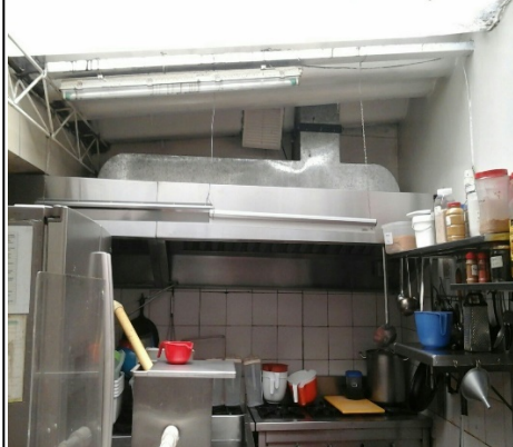
Fotografía 4: Vista área de cocción.