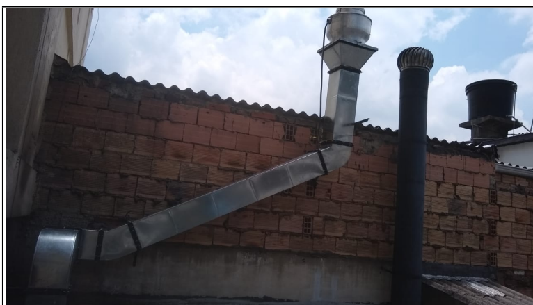
Fotografía 5: Ducto de desfogue.