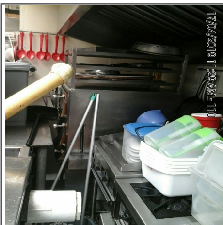
Fotografía 3: Estufa, horno, y plancha